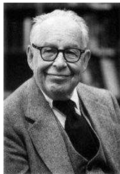
Figura 3: Charles Richter

En 1935, Charles Richter (Figura 3), sismólogo, propone junto con el germano-estadounidense Beno Gutenberg una escala de magnitud para especificar el tamaño de los terremotos en el sur de California. La escala logarítmica de Richter, permite medir una amplia gama de terremotos, desde sismos no sentidos de magnitud cercanas a 3, a terremotos mayores que pueden alcanzar magnitudes 8-9.