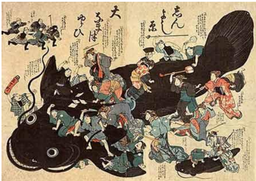
Figura 1: Pintura sobre madera que muestra al mitológico pez "Namazu". El gigantesco bagre era el culpable de los movimientos terrestres en la cultura japonesa.

En Japón, la mitología y el folklore asociaban el desastre de los terremotos a un siluro gigante que denominaban "Namazu" (Figura 1), especie de inmenso bagre, que al mover su cola hacía temblar la Tierra.